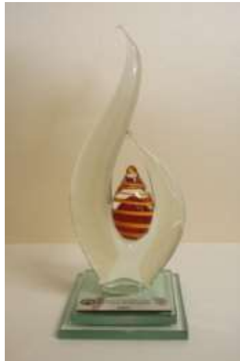
Toekenning ontvang (kunstenares Liz Lacey)

Twee verdere gebeurtenisse om 'n belangrike projek mee af te sluit: Tydens die Wes-Kaapse Kuns, Kultuur, en Erfenis-toekenningseremonie in 2007 by die Kasteel, ontvang die TEPC-span die gesogte toekenning as beste instelling wat die Argiefdiens deur gepubliseerde artikels en/of besoeke bevorder het.