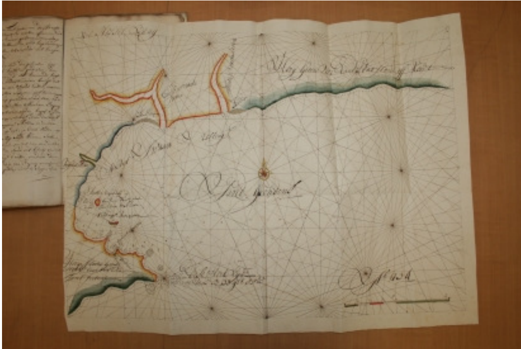
Kaart van Mosselbaai en omstreke (1734)