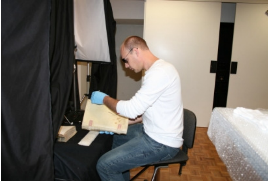
Trust-fotograaf, Johan Liebenberg, werksaam in die Nasionaal Archief, Den Haag

Sodra die Trust befondsing kan kry, sal hierdie afbeeldings getranskribeer, voorberei en op CD geplaas word, sodat dit vir openbare gebruik beskikbaar kan wees.